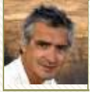
» Le huitième mort de Tibhirine

Françalgérie, crimes et mensonges d'États