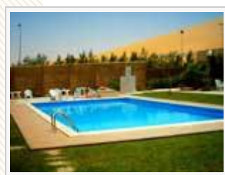
Hassi-Messaoud "l'étranger" visé par le GSPC pour "se faire remarquer"

Tandis que « le billettiste d'El Watan » s'interroge, dans un clin d'oeil, "le GSPC est-il kabyle ?" Zerhouni et Tounsi mettent le paquet en hommes et en moyens pour "sécuriser totalement" Alger tant contre le terrorisme "affaibli" et "résiduel" qui frappe "les étrangers", que contre "la grande délinquance dont souffre la capitale".