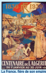
La France, fière de son empire

« L'Algérie n'est pas une colonie proprement dite, mais un royaume arabe. Les indigènes ont comme les colons un droit égal à ma protection. Je suis aussi bien l'Empereur des Arabes que l'Empereur des Français ».