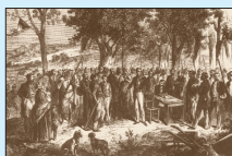
Distribution de lots de terrain aux concessionnaires d'un village, « L'illustration » 1856.